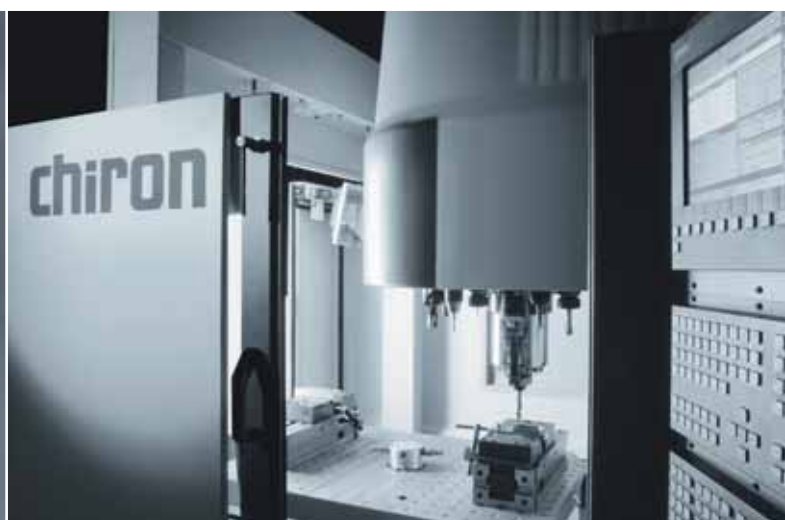
Table porte-pièces à indexage alternatif

La FZ 12 W est fournie avec une table porte-pièces à changement rapide. 2,9 secondes suffisent pour pivoter de 0° à 180° . Une pièce est usinée d'un côté tandis qu'une autre est chargée/déchargée en parallèle de l'autre côté, ce qui permet de réduire les temps morts à un minimum: c'est tout l'art de la production à grande vitesse (High-Speed-Manufacturing)