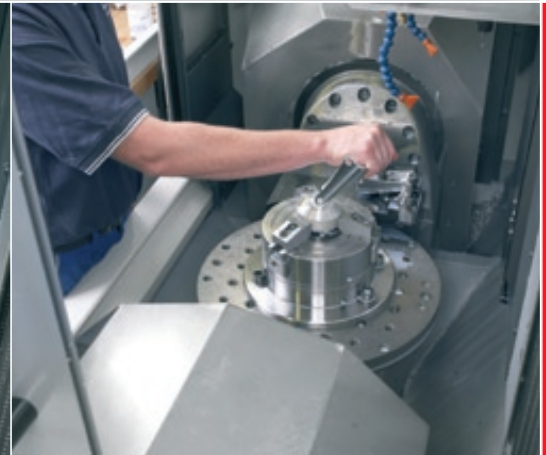
Kurzer Prozess: Nach der 5-Achsbearbeitung wird die Sollbruchstelle in der 2ten Aufspannung gefinished.

steller, der unsere Bearbeitungsaufgabe angenommen hat.“