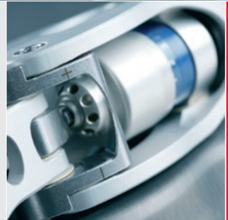
Fertigungstechnologien für Produktinnovationen: Prothesen von Otto Bock bringen Mobilität und Unabhängigkeit zurück

Für die (weltweit) vernetzte Planung, Organisation und das Controlling von Vertrieb, Fertigung, Logistik und Service setzt Otto Bock auf SAP/R3. Die Bereiche Entwicklung, Konstruktion und Betriebsmittelbau nutzen für 3D CAD Pro/E und die 3D NC-Programmie-